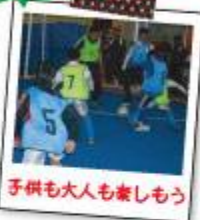
子供も大人も楽しもう

主催：一般社団法人三重県サッカー協会 後援：公益財団法人日本サッカー協会 特別協賛：キリンビール株式会社 キリンビバレッジ株式会社 キリン株式会社