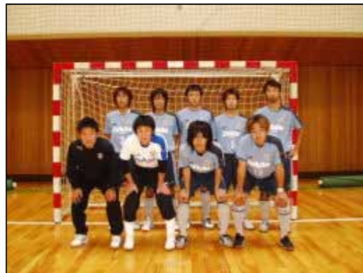
ジュビロ磐田フットサルクラブ