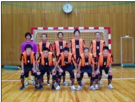
MEMBER OF THE GANG/SPOTAKA