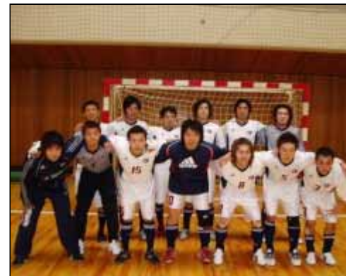
愛知ニューウェーブス