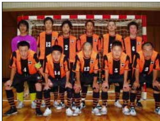
MEMBER OF THE GANG/SPOTAKA